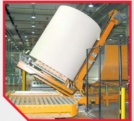
Rullan kääntö Rollerille.